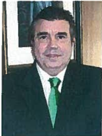
Manuel Alfonso Villa Vigil Presidente del Consejo General de Colegios de Odontólogos y Estomatólogos

EN LOS ÚLTIMOS AÑOS han empezado a proliferar clínicas franquiciadas y marcas que parecen funcionar con criterios y fines sustancialmente diferentes a los de las clínicas convencionales de